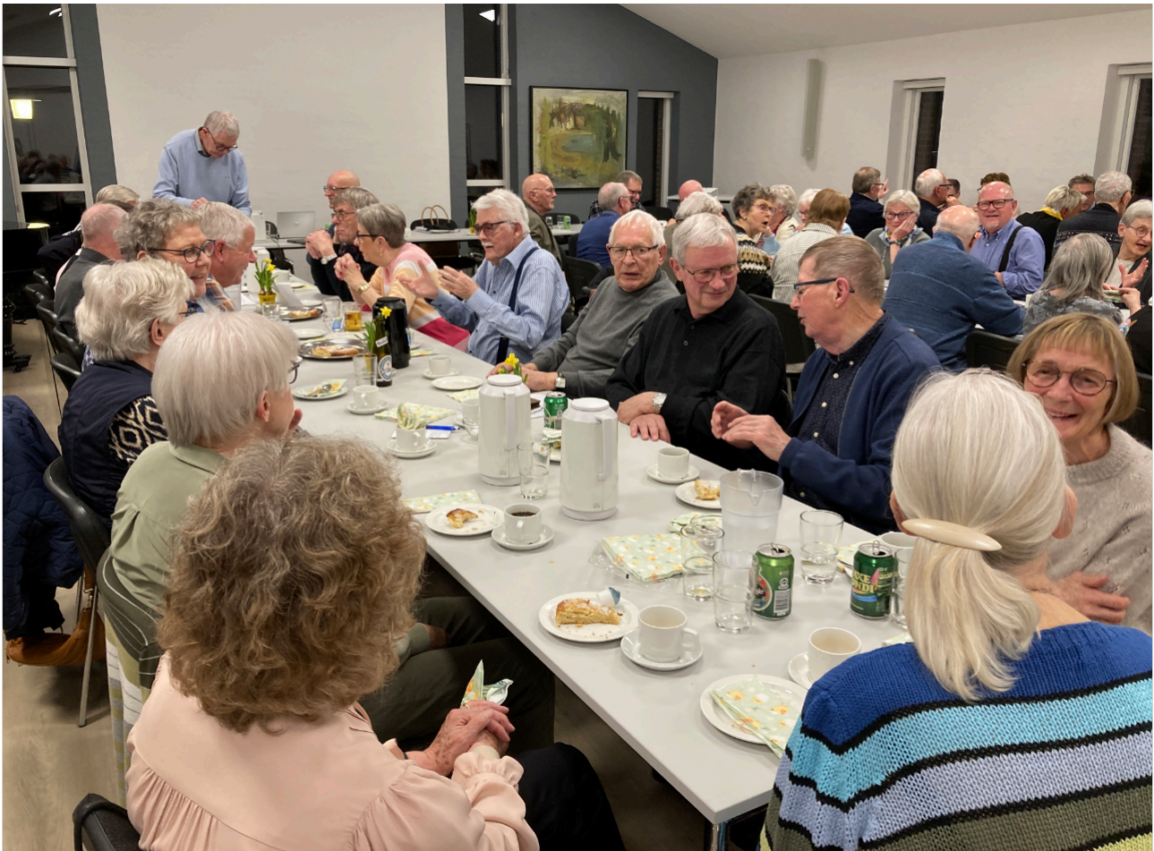
Der er tradition for et godt fremmøde ved Ejerforeningens generalforsamlinger. Den i marts 2025 var ingen undtagelse. Som altid gik snakken livligt i kaffepausen.

hjemmeside. Det er ikke længer lovligt at nyopsætte en ladeboks i egen garage.