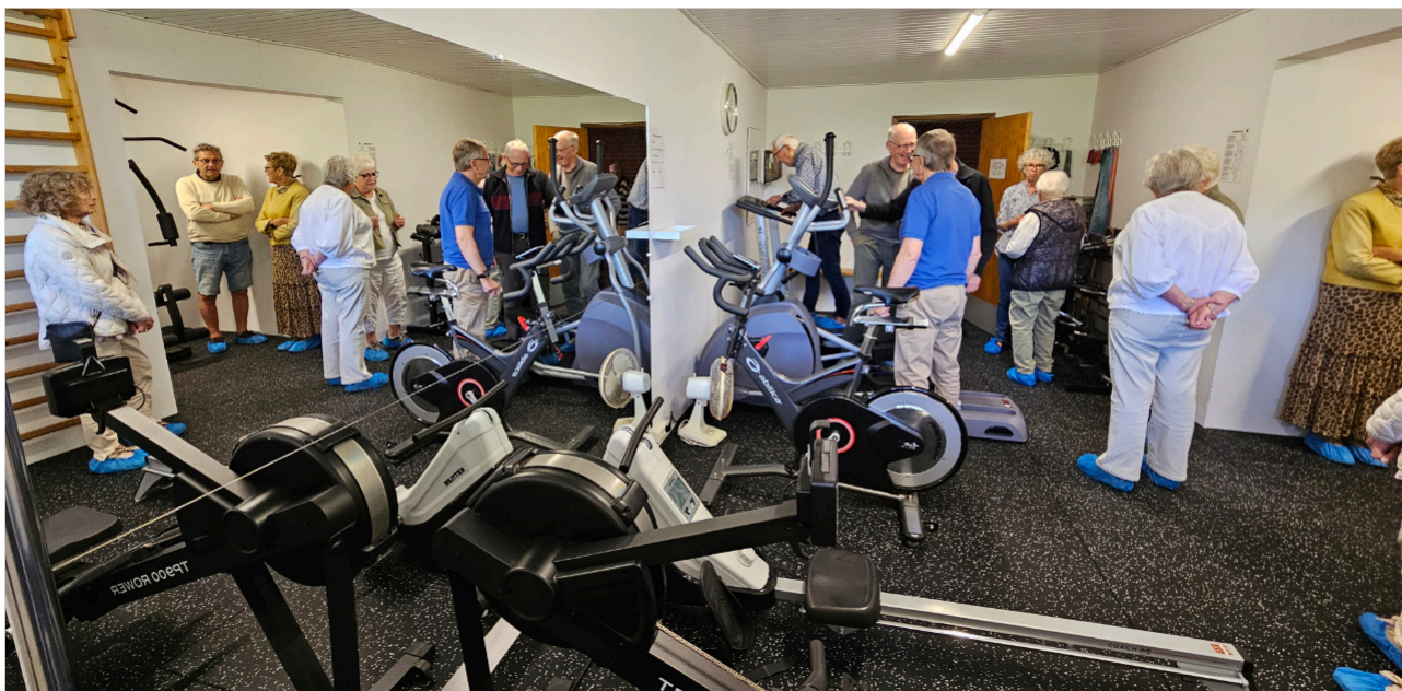
Genindvielsen af motionsrummet midt i maj var et tilløbsstykke, og alle roste det flotte resultat.

● Motionsrummet: I løbet af vinteren 24/25 opstod der et problem med fugt fra ydervæggen i motionsrummet i Blok 16. Folk med forstand på murværk og kloak konkluderede, at fugten skyldtes tagvand på afveje. Derfor blev det besluttet at erstatte den gamle afløbsbrønd, som viste sig at være knækket, med en ny flexbrønd. Gjellerup-firmaet H. Hvolgaard blev hyret til den del af opgaven, og indenfor tog murerfirmaet Viggo Søby sig af at rense og reparere murværket. Den gamle gulvbelægning i motionsrummet blev skiftet ud med gummimåtter, beregnet til brug i fitness-lokaler. Måtterne kan nemt løftes op, når gulvet fremover skal tilses.